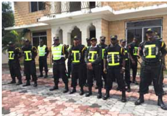
2023年2月10日星期六，中国大型科幻电影《流浪地球》首次在坦桑尼亚上映。此次活动主

办方是由华助中心和各大商会联合举办，并且邀请坦桑尼亚驻中国大使陈明建与在坦华侨同胞共同观赏。