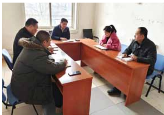
2023年2月9日，北京第三分公司以“珍

惜当下，拼搏奋进”为主题召开季度工作形势分析会，深入分析分公司现状和面临瓶颈，研究下一步工作措施办法，不负集团总经理孙红玉在新年度里对华远所有员工提出的殷切期望。