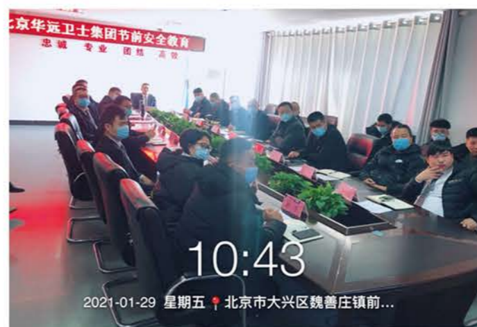
春节临近，各类安全事故隐患随之增多，加之疫情尚未完全消除，为了集团公司各项工作顺利开展，确保大家度过一个安全祥和的春节。

2021年1月29日集团培训部在公司月例会后组织大家学习了节前安全教育的相关知识。