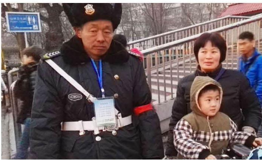
主要负责田村辖区公交站点，过街天桥守卫工作。

2015年12月24日，接街道办事处领导通知，配合街道做好双节期间田村辖区安全反恐保障任务。项目部积极配合抽调42人参与此次执勤任务