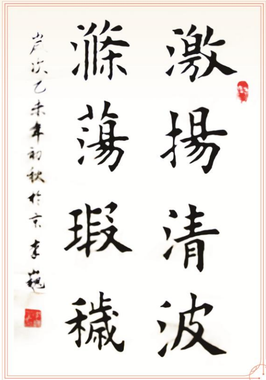
白云观项目李巍供稿