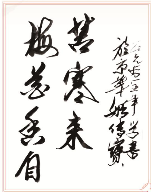
丽泽项目部姬传宝供稿